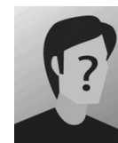
Wie wär's mit Dir?