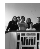
Gruppenfoto der Fachschaft