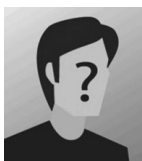
Wie wär's mit Dir?